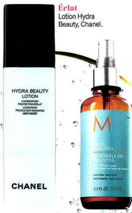
Éclat Lotion Hydra Beauty, Chanel.

Pour se remonter. De la vitamine C tous les matins. Jamais de café.