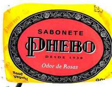
Doudou Savonnette à la rose, Phebo.