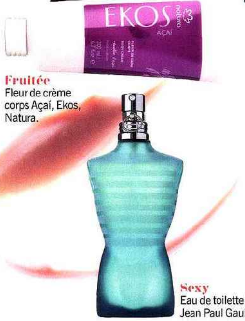
Fruité Fleur de crème corps Açaï, Ekos, Natura.