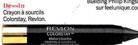
Dessin Crayon à sourcils Colorstay, Revlon.