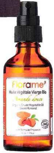
Satin Huile d'amande douce, Florame.