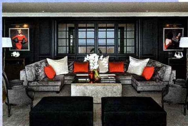
Un penthouse d'exception de 400 m2, réalisé en partenariat avec la Maison Dior, avec ses lambris grisés, son parquet en point de Hongrie et ses immenses canapés aux coussins carmins .