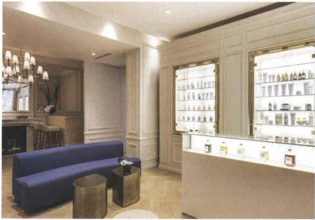
Nella foto grande dell'Ambassade al 32 degli Champs Elysee. Qui sopra e sotto due sale interne, a destra alcuni prodotti