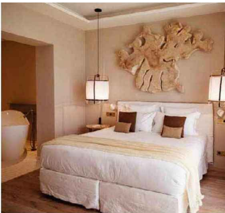
L'une des chambres, avec sa salle de bains attenante. Un effet « maison de vacances » : le luxe dans la sobriété.