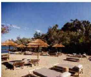
En haut : des spécialités corses au petit déjeuner. En bas : la plage privée de l'hôtel.