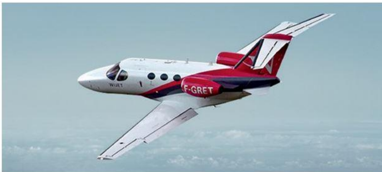
Mimos extras

Recupere as energias no Biologique Recherche Spa da sala VIP La Première, no aeroporto Charles de Gaulle, em Paris. A máscara oxigenadora suaviza as tensões e recupera a pele no ato.