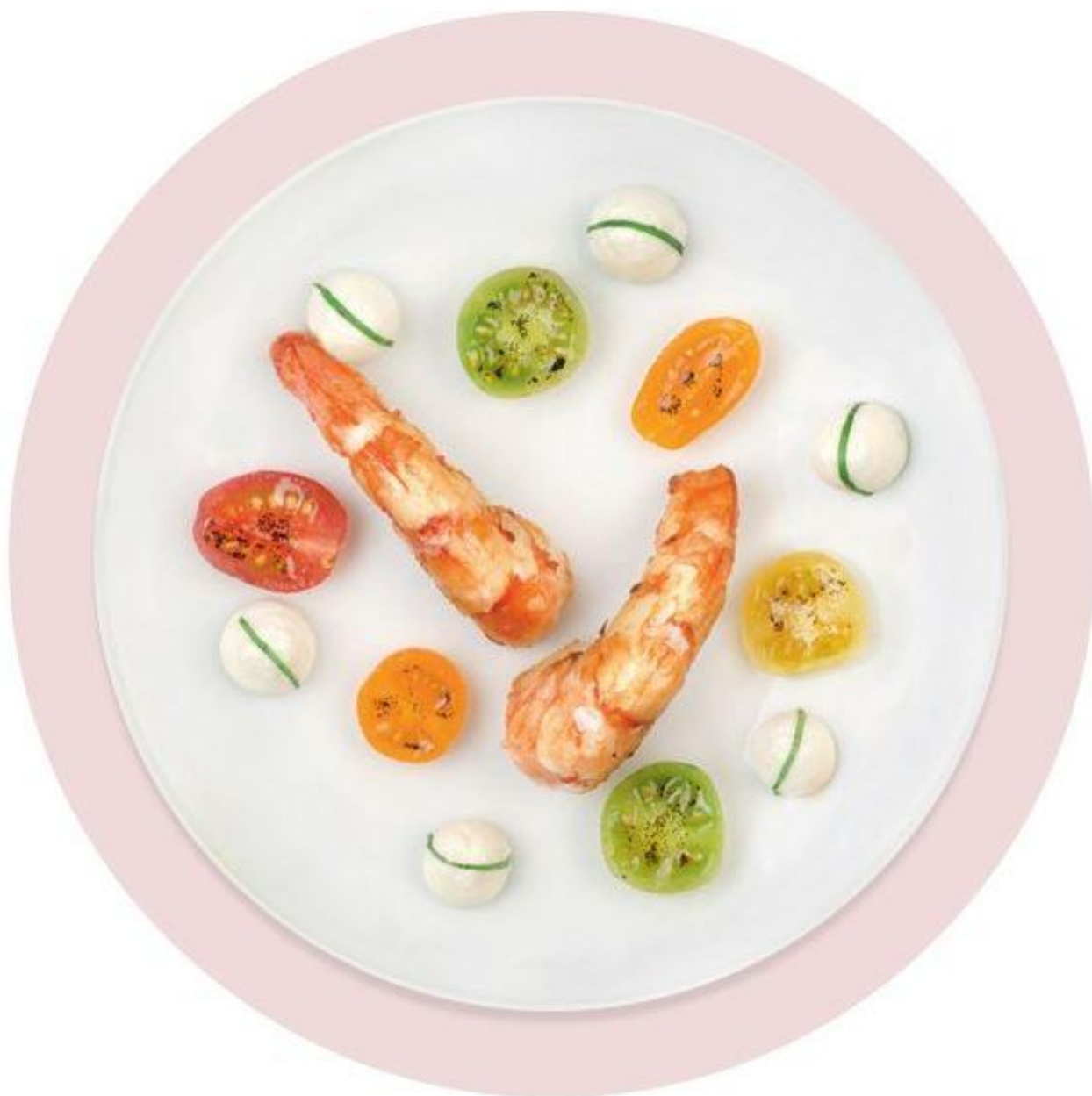
Mimos extras

Quatro serviços oferecidos aos clientes la Première que vão fazer você se sentir nas nuvens